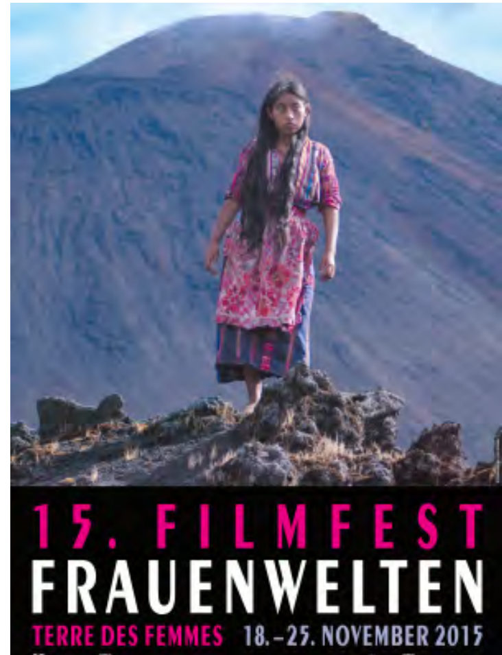
Plakat des 15. Filmfest FrauenWelten