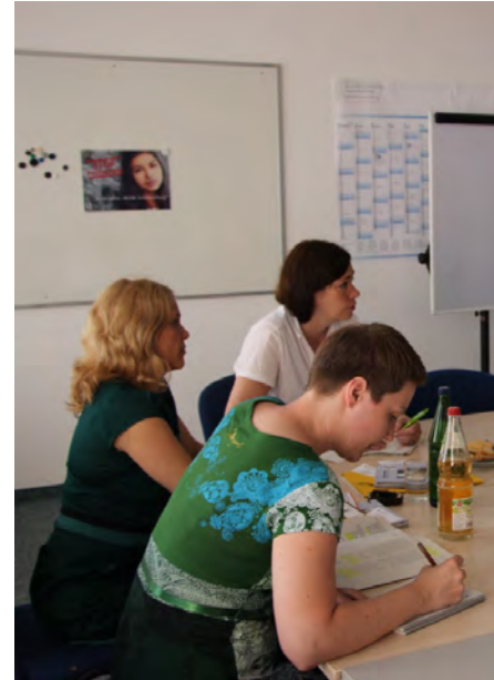
TERRE DES FEMMES- Referentinnen im Gespräch mit der Politik

Wir setzten uns außerdem auf EU-Ebene für eine EU-weite Erhebung zu Anzahl und Ausmaß von Frühehen und Zwangsheirat in Europa ein und leisteten einen Expertinnen-Beitrag zu der vom Europäischen Parlament in Auftrag gegebenen Untersuchung „Forced Marriage from a gender perspective“.