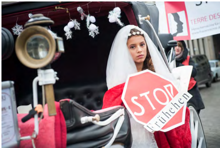
TERRE DES FEMMES-Protestaktion gegen Frühehen

Aufgrund der erschreckenden Zahlen und aufgrund der Tatsache, dass auch in Deutschland Minderjährige verheiratet werden, beschlossen wir, uns für 2 Jahre verstärkt mit dem Thema auseinanderzusetzen. Am 20. September 2014, dem Weltkindertag, starteten wir einen zweijährigen Schwerpunkt zur Abschaffung der Frühehen unter dem Titel „STOP Frühehen!“. Wir haben uns in diesen zwei Jahren vermehrt durch Aufklärungs- und Lobbyarbeit dafür eingesetzt, dass Frühehen weltweit geächtet und perspektivisch bis 2030 abgeschafft werden.