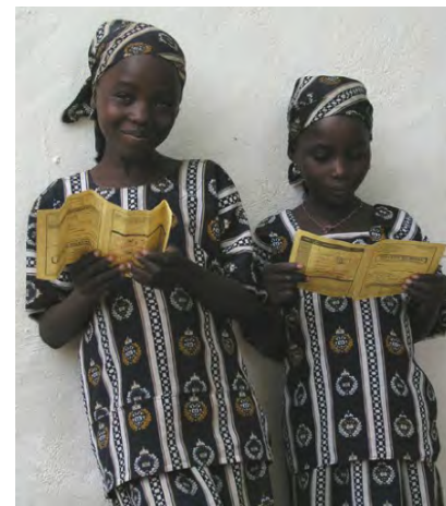
Schülerinnen die vom Verein AFFMHL im Nordkamerun betreut werden

In Nordkamerun vergibt der Verein AFFMHL (Appui à la Promotion Scolaire des Filles et des jeunes Femmes de M'lay, Huva et Ldama) Stipendien an Mädchen, um ihnen den Schulbesuch zu ermöglichen. Aufgrund des hohen Schulgelds im Mandara-Gebirge werden Mädchen häufig früher von der Schule genommen, um sie zu verheiraten. Mit Mitteln von TERRE DES FEMMES und dem BMZ konnte ein Mädchen-Schulgebäude errichtet werden, in dem zur Zeit rund 60 Mädchen unterrichtet werden. Das Projekt zielt nicht nur darauf ab, Mädchen individuell zu fördern, sondern auch darauf, einen gesellschaftlichen Wandel in Gang zu setzen. Die geförderten Mädchen sollen zu Vorbildern werden und auch andere Mädchen dazu motivieren, die Schule abzuschließen und einen Beruf zu erlernen.