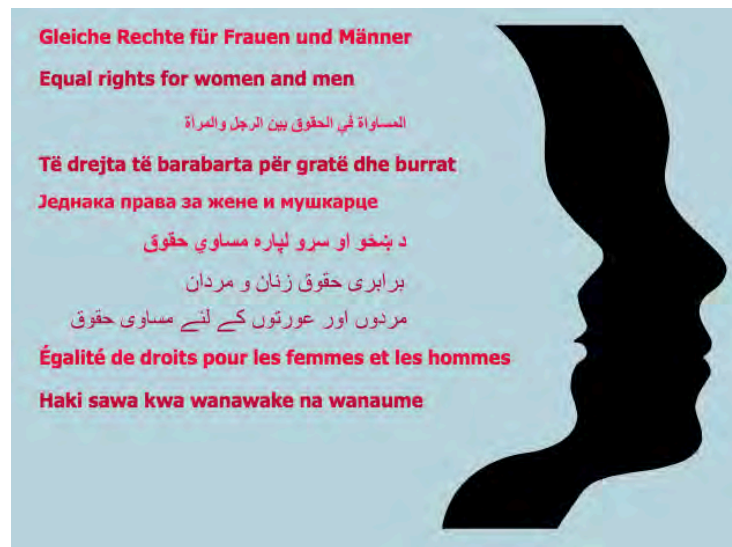
Mehrsprachiger Flyer „Gleiche Rechte für Frauen und Männer“

Mädchen und Frauen auf der Flucht sind besonders schutzbedürftig, denn sie sind einem besonderen Risiko geschlechtsspezifischer Gewalt ausgesetzt. In Flüchtlingsunterkünften in Jordanien, im Libanon und in der Türkei steigt die Zahl der Frühverheiratungen drastisch an. Während vor dem Krieg in Syrien bei 13% aller Hochzeiten mindestens ein Ehegatte minderjährig war, sind es nach Angaben der SOS-Kinderdörfer aktuell über 50%. Die Eltern stimmen der frühen Heirat aus finanziellen Gründen zu oder weil sie in der Heirat eine Möglichkeit sehen, ihre Tochter zu schützen.