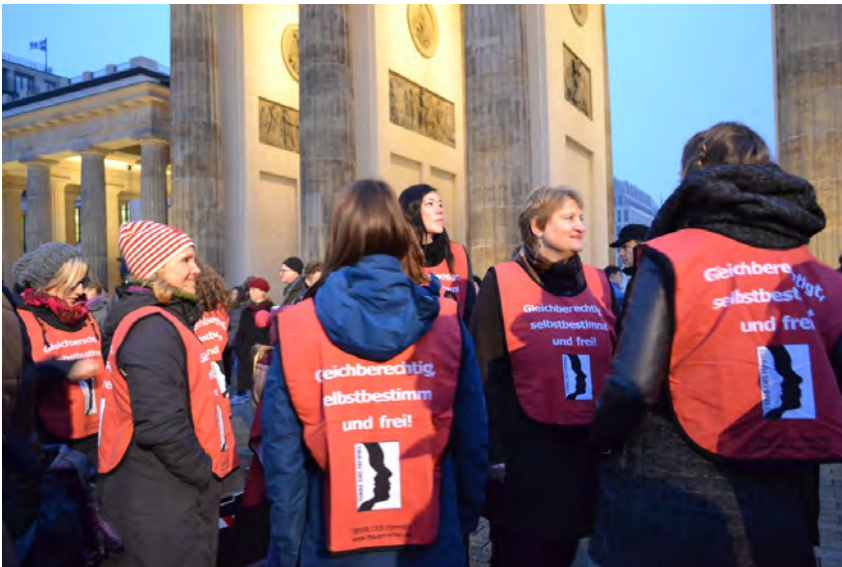
TERRE DES FEMMES-Mitarbeiterinnen bei der Tanzdemo „One Billion Rising“

Jedes Jahr kommen Frauen am 14. Februar im Zuge der internationalen Kampagne „One Billion Rising“ zusammen und tanzen gemeinsam gegen Gewalt an Frauen. Sie tanzen im Namen der eine Milliarde (one billion) Frauen, die weltweit Opfer von Gewalt sind. TERRE DES FEMMES beteiligt sich seit der ersten Tanzdemo 2013 an der Aktion und war im Jahr 2016 mit einem Informationsstand vor Ort, um über die Gefahren von Frühhehen aufzuklären und Unterschriften für unsere Petition zu sammeln.