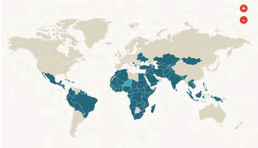
Aufkommen von Frühehen weltweit

Mit einer Rate von 76% sind Frühehen im Niger am weitesten verbreitet, gefolgt von der Zentralafrikanischen Republik (68%), Tschad (68%), Mali (55%), Guinea (52%), Bangladesch (52%), Südsudan (52%), Burkina Faso (52%), Mozambique (48%) und Indien (47%). Die Rate gibt den Anteil der 20- bis 24-Jahre alten Frauen, die vor ihrem 18. Geburtstag verheiratet wurden, an und wird von UNICEF ermittelt.