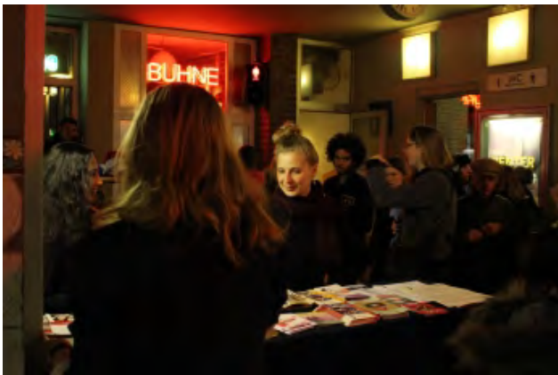
Infostand bei der Berlin Feminist Film Week

TERRE DES FEMMES ging im Bereich des Schwerpunkts „STOP Frühehen!“ mehrere Filmkooperationen ein, um die ZuschauerInnen über die traurige Realität hinter den Filmen zu informieren. Einer unserer Kooperationsfilme war „Das Mädchen Hirut“, ein äthiopischer Film zum Thema Zwangsehe, der den wahren Fall der 14-jährigen Hirut aus dem Jahr 1996 nacherzählt. Wir begleiteten den Film bei seiner deutschlandweiten Premiere zum internationalen Frauentag am 8. März 2015 und bei der Berlin Feminist Film Week. Dort fand eine Diskussion zum Thema Zwangsehen mit einer TERRE DES FEMMES-Expertin statt und unsere Praktikantinnen betreuten einen Infotisch und riefen die BesucherInnen zur Teilnahme an einer Fotoaktion gegen Frühehen auf.