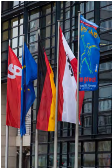
Die TERRE DES FEMMES- Fahne vor dem Willy-Brandt- Haus in Berlin