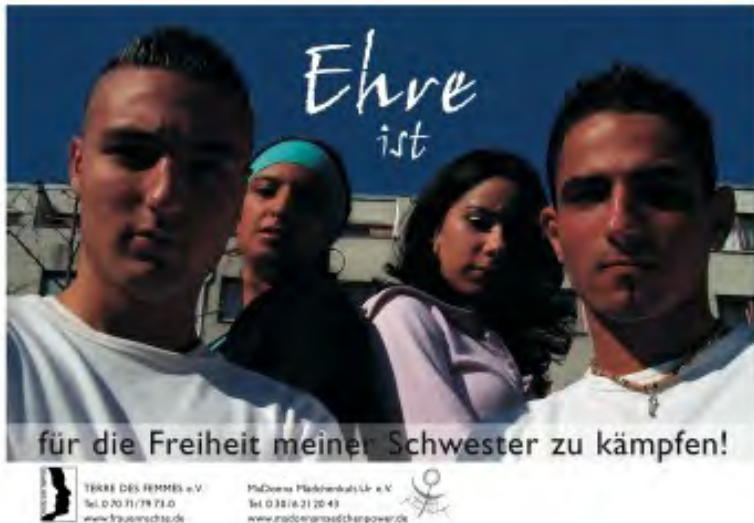
Kampagnenmotiv „Ehre ist für die Freiheit meiner Schwester zu kämpfen!“ © TERRE DES FEMMES

Unsere Erfahrung zeigt, dass viele Mädchen und junge Frauen gar nicht wissen, welche Rechte sie in Deutschland haben. Daher ist es wichtig, die potentiell Betroffenen direkt anzusprechen und zu informieren sowie dritte Personen, wie Lehrkräfte, SozialarbeiterInnen und Fachkräfte aus Behörden zu sensibilisieren und zu schulen, damit sie Betroffene besser unterstützen können.