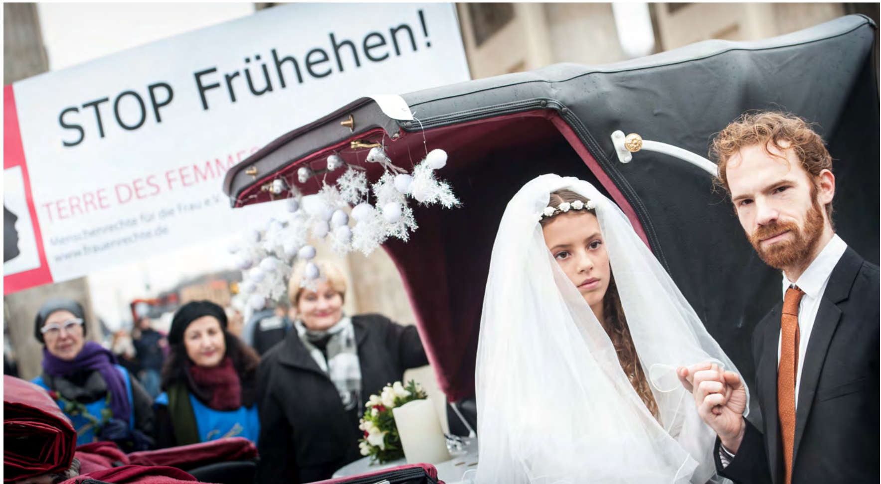
Inszenierung einer Minderjährigehochzeit am Brandenburger Tor