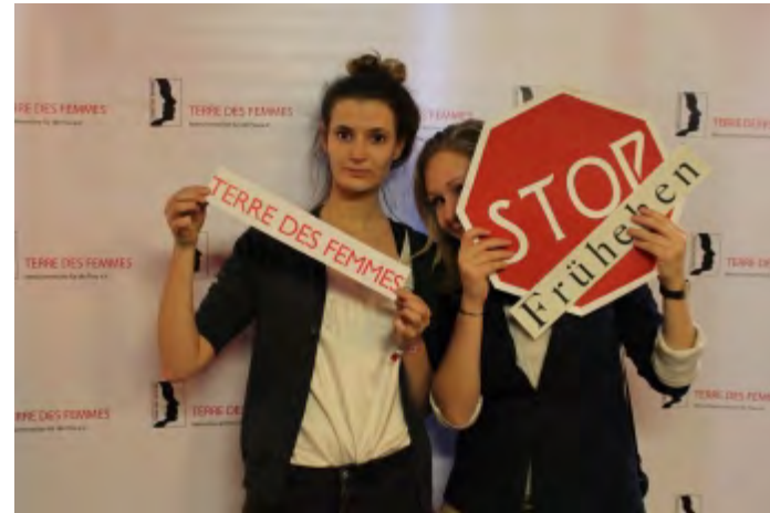
Fotoaktion gegen Frühehen bei der Berlin Feminist Film Week

Der Film „Mustang“ handelt von fünf freiheitsliebenden Schwestern in der Türkei und problematisiert Zwangsheirat sowie die sexualisierte Wahrnehmung von Frauen. Bei der offiziellen Premiere in Köln am 23. Februar 2016 richtete die örtliche Städtegruppe einen Infostand ein und wir freuten uns sehr, dass TV-Moderatorin Nazan Eckes als prominente TERRE DES FEMMES-Botschafterin unter den Gästen war. Bei den Previews in Hamburg, München, Berlin und Nürnberg fanden im Anschluss an den Film Gespräche statt, an denen jeweils eine TERRE DES FEMMES Expertin teilnahm.